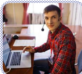
IT: жизнь в «облаках» (стр. 4)