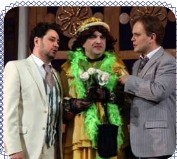
Театральные встречи (стр. 8 – 9)