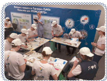
Задай «ТеМП»! (стр. 7)