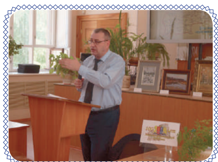
С юбилеем, Ивановский край! (стр. 5)