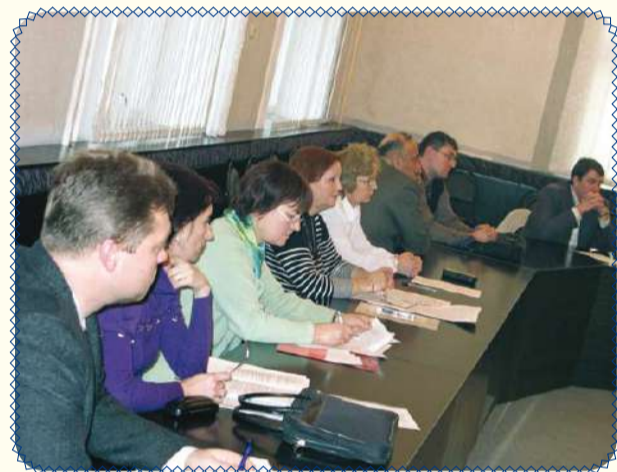
О философии с размахом (стр. 4)