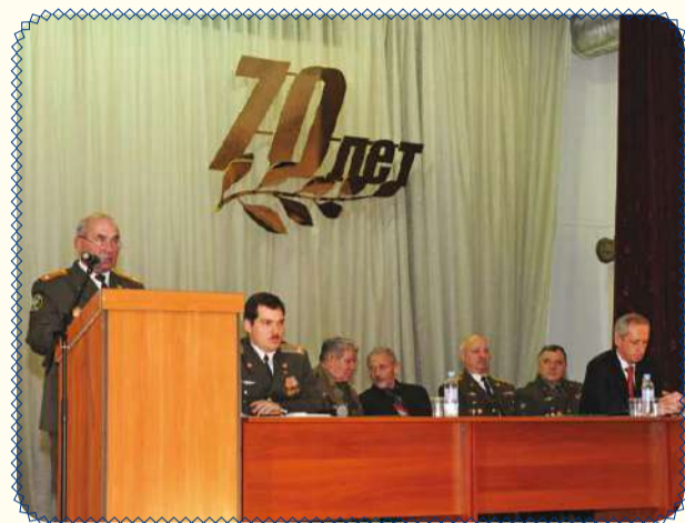
Юбилей самого военного подразделения ИГЭУ! (стр. 3)