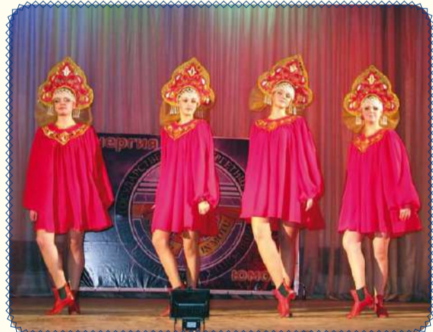
Лучшее от факультетов к Дню энергетика! (стр. 6)