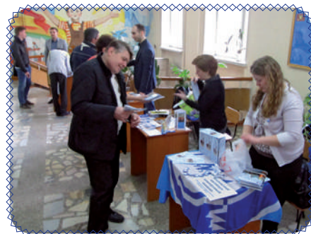
Время учиться в России (стр. 5)