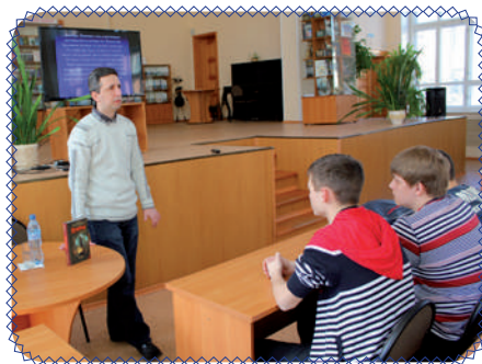
Литературные встречи (стр. 9)