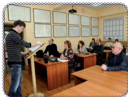
«Науки юношей питают...» (стр. 2 - 3)