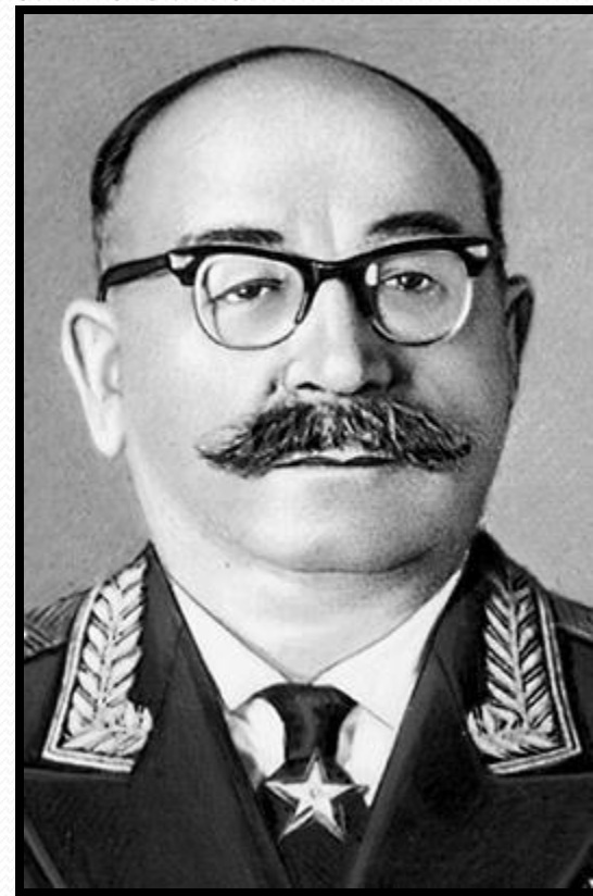
Ротмистров Павел Алексеевич. Командующий 5-ой гвардейской танковой армии.

По сообщениям, в битве под Прохоровкой сошлись около 1500 танков с обеих сторон. Это стало крупнейшим в истории войн, таковым сражением. Потери сторон указывались различные. Но в целом, сошлись на том, что потери танков у русских были существенными. Под суд чуть ли не отдали командующего танковой армией Ротмистрова за большие потери. Введенные в бой танки Пантера, Королевский тигр, Фердинанды, самоходки, нанесли существенный урон нашим танкистам. Но это не стало переломным моментом для Германии. Победило полководческое искусство Красной Армии. Русские выстояли в обороне и затем перешли в наступление.