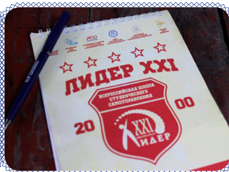
Школа актива «Лидер» (стр. 6)