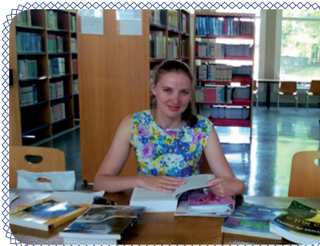
Энергеты в Безансоне (стр. 4 – 5)