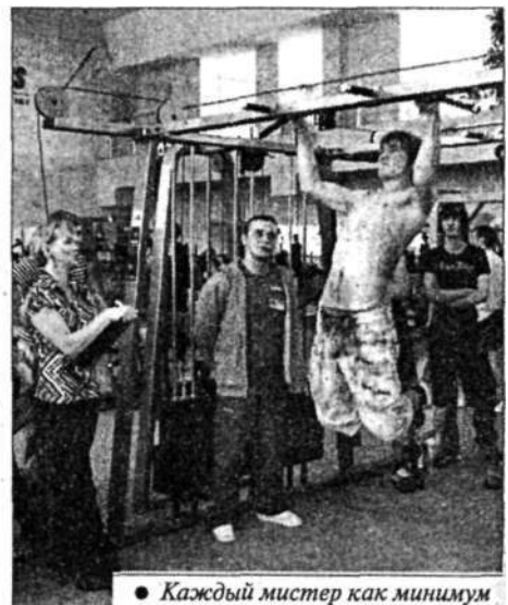
● Каждый мистер как минимум четыре раза, но подтянулся.