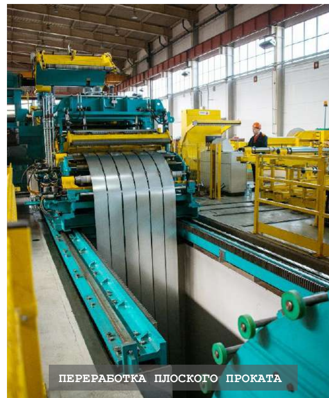
ПЕРЕРАБОТКА ПЛОСКОГО ПРОКАТА