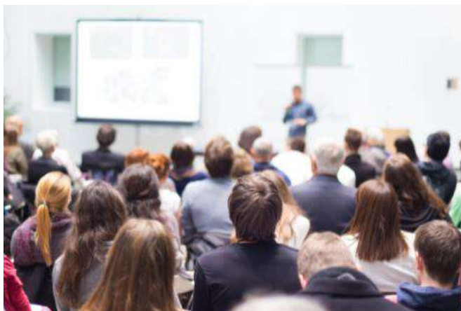
ПОВЫШЕНИЕ КВАЛИФИКАЦИИ (возможность дополнительного обучения, посещения