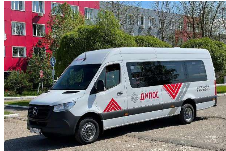
КОРПОРАТИВНЫЙ ТРАНСПОРТ (проезд сотрудников к месту работы и обратно)