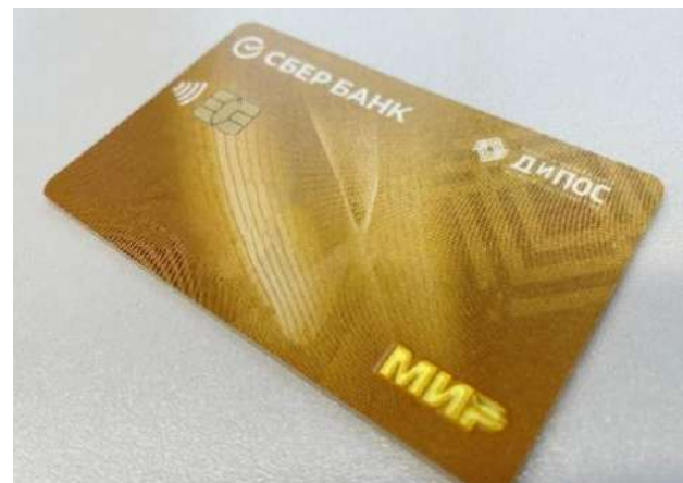
ПРОЗРАЧНОСТЬ В ОПЛАТЕ ТРУДА (трудоустройство согласно ТК РФ, белая