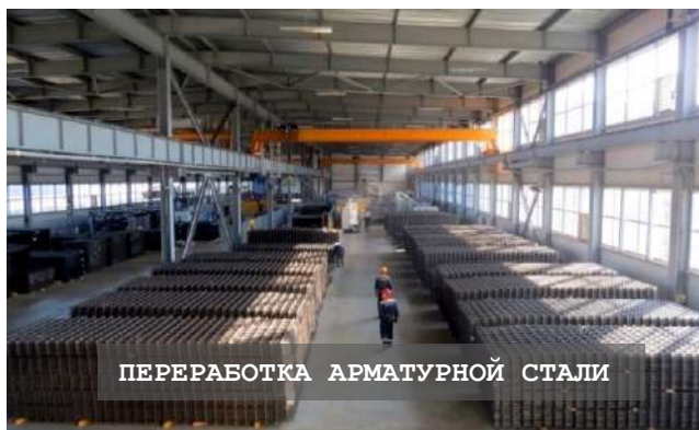
ПЕРЕРАБОТКА АРМАТУРНОЙ СТАЛИ