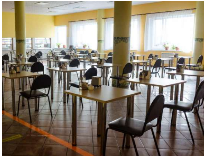
БЕСПЛАТНОЕ ПИТАНИЕ (бесплатные обеды и ужины для сотрудников всех смен в корпоративной столовой)