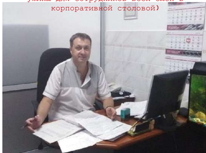
МЕДИЦИНСКИЙ ПУНКТ (забота о здоровье каждого сотрудника, проведение углубленных