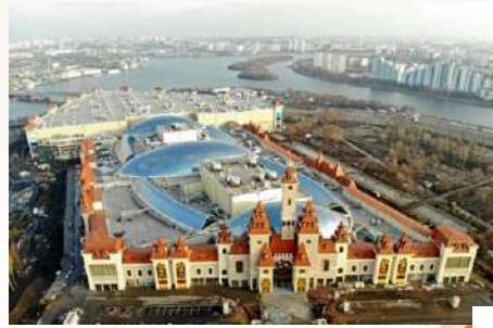
Объекты реконструкции ВДНХ