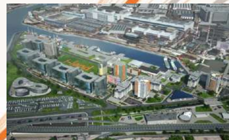
Комплекс зданий ММДЦ «Москва-Сити»